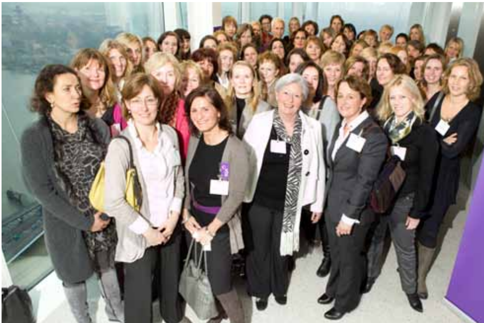
Ladies@Risk in januari 2012 te gast in de Maastoren

Op 24 april 2012 bestuderen de Ladies@Risk daarom lokale en mondiale ontwikkelingen van dichtbij en worden mogelijke kansen en uitdagingen voor de branche geëvalueerd.